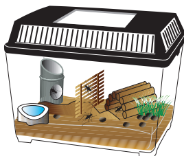
共食いを防ぐ為に、カクレガを 多く入れてあげましょう

スズムシの幼虫が孵化をする時につかまれる様に、足場になる木や隠れ家になる物を入れてあげましょう。 木の板を立てかけておくのも良いでしょう。